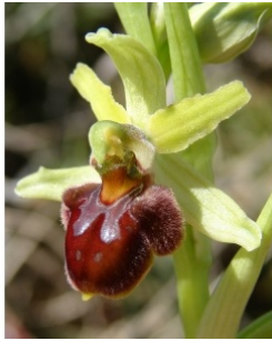
à inconnu observée le 6 avril 2014 par Paul Fabre

Réseau Tela botanica, Programme Flora Data, version dynamique.