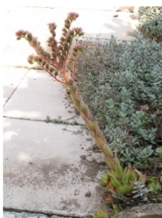
à inconnu observée le 30 juillet 2004 par Alain Bigou

Réseau Tela botanica, Programme Flora Data, version dynamique.