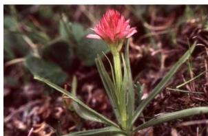
à inconnu observée le 2 juillet 1994 par Liliane Roubaudi

Réseau Tela botanica, Programme Flora Data, version dynamique.