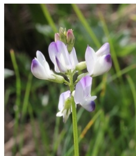
à inconnu observée le 7 juillet 2015 par Marie Portas

Réseau Tela botanica, Programme Flora Data, version dynamique.