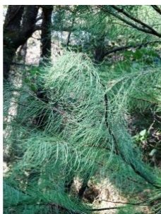
à inconnu observée le 30 septembre 2016 par Alain Bigou

Réseau Tela botanica, Programme Flora Data, version dynamique.