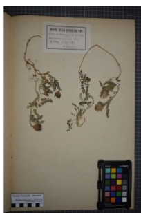
à inconnu observée le 1 juin 1871 par Herbier Pontarlier-marichal

Réseau Tea Botanica , Programme Flora Data, version dynamique.