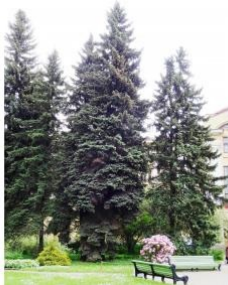
à inconnu observée le 28 mai 2019 par Alain Bigou

Réseau Tela botanica, Programme Flora Data, version dynamique.