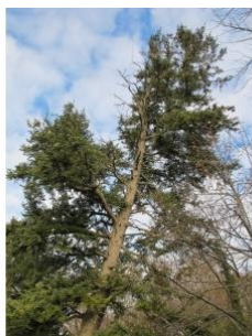
à inconnu observée le 6 avril 2009 par mpduflot@...

Réseau Tela botanica, Programme Flora Data, version dynamique.