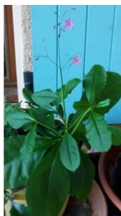
à inconnu observée le 2 août 2018 par jean Chatelus

Réseau Tela botanica, Programme Flora Data, version dynamique.