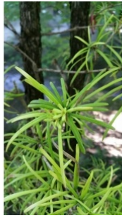
à inconnu observée le 18 août 2017 par Cman Mario

Réseau Tela botanica, Programme Flora Data, version dynamique.