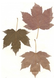
à inconnu observée le 17 juin 1993 par Thierry Christophe Schlienger

Réseau Tela botanica, Programme Flora Data, version dynamique.