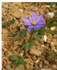
à inconnu observée le inconnue par Thierry Pernot

Réseau Tela botanica, Programme Flora Data, version dynamique.