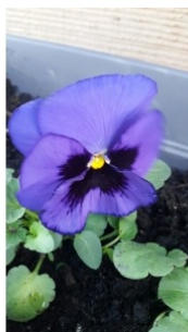
à inconnu observée le 10 mars 2016 par David

Réseau Tela botanica, Programme Flora Data, version dynamique.