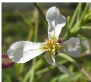
à inconnu observée le 8 avril 2016 par jcech

Réseau Tela botanica, Programme Flora Data, version dynamique.