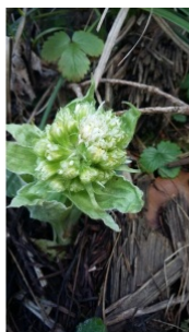
à inconnu observée le 14 mars 2020 par yoyooo21@...

Réseau Tela botanica, Programme Flora Data, version dynamique.