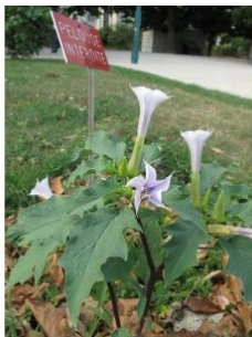
à inconnu observée le 18 août 2010 par Marie Portas

Réseau Tela botanica, Programme Flora Data, version dynamique.