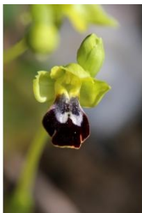
à inconnu observée le 12 mars 2017 par allemand.denis@...

Réseau Tela botanica, Programme Flora Data, version dynamique.