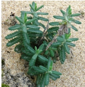
à inconnu observée le 20 janvier 2016 par Ans Gorter

Réseau Tela botanica, Programme Flora Data, version dynamique.