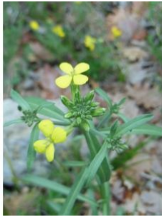
à inconnu observée le 6 mai 2018 par Quentin Lebastard

Réseau Tela botanica, Programme Flora Data, version dynamique.