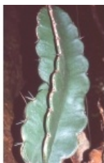
à inconnu observée le 17 octobre 2003 par Liliane Roubaudi

Réseau Tela botanica, Programme Flora Data, version dynamique.