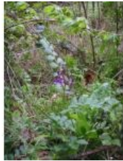
à inconnu observée le 27 avril 2008 par Benjamin Deslandes

Réseau Tela botanica, Programme Flora Data, version dynamique.