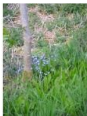
à inconnu observée le 27 avril 2008 par Benjamin Deslandes

Réseau Tela botanica, Programme Flora Data, version dynamique.