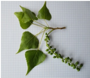
à inconnu observée le 1 mai 2012 par Dominique Remaud

Réseau Tela botanica, Programme Flora Data, version dynamique.