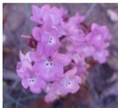
à inconnu observée le 26 mai 2012 par Genevieve Botti

Réseau Tela botanica, Programme Flora Data, version dynamique.