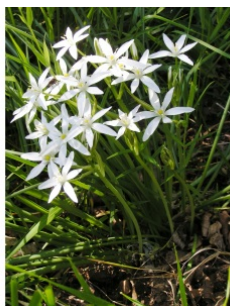
à inconnu observée le 8 mai 2005 par Alain Bigou

Réseau Tela botanica, Programme Flora Data, version dynamique.