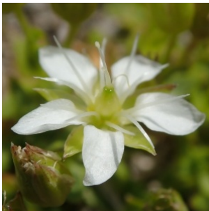
à inconnu observée le 24 août 2018 par Michel Monteil

Réseau Tela botanica, Programme Flora Data, version dynamique.