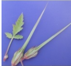
à inconnu observée le 28 avril 2013 par Genevieve Botti

Réseau Tela botanica, Programme Flora Data, version dynamique.