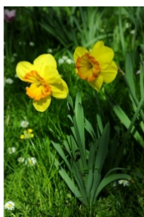
à inconnu observée le 18 avril 2011 par Jean-Pierre Cazes

Réseau Tela botanica, Programme Flora Data, version dynamique.