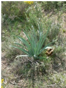
à inconnu observée le 25 avril 2011 par Pierre Bonnet

Réseau Tela botanica, Programme Flora Data, version dynamique.