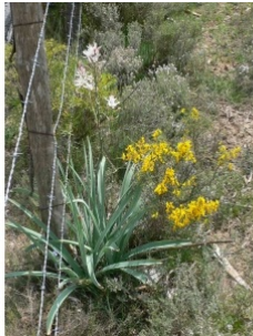
à inconnu observée le 25 avril 2011 par Pierre Bonnet

Réseau Tela botanica, Programme Flora Data, version dynamique.