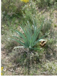
à inconnu observée le 25 avril 2011 par Pierre Bonnet

Réseau Tela botanica, Programme Flora Data, version dynamique.