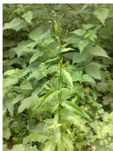
à inconnu observée le 16 mai 2014 par rouzaud.sibille@...

Réseau Tela botanica, Programme Flora Data, version dynamique.