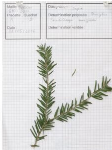
à inconnu observée le 28 mai 2016 par Pierre Crouzet

Réseau Tela botanica, Programme Flora Data, version dynamique.