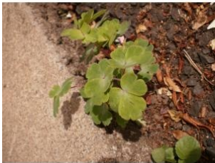
à inconnu observée le 25 juin 2015 par Christine Jourdan

Réseau Tela botanica, Programme Flora Data, version dynamique.