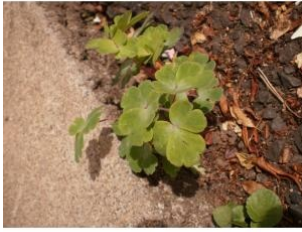
à inconnu observée le 25 juin 2015 par Christine Jourdan

Réseau Tela botanica, Programme Flora Data, version dynamique.