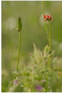
à inconnu observée le 1 juin 2012 par Gaëlle Nauche

Réseau Tela botanica, Programme Flora Data, version dynamique.