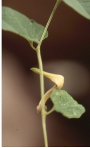
à inconnu observée le 1 mai 1994 par Liliane Roubaudi

Réseau Tela botanica, Programme Flora Data, version dynamique.