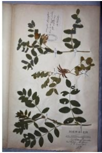
à inconnu observée le 1 juillet 1872 par Herbier Guittot

Réseau Tela botanica, Programme Flora Data, version dynamique.