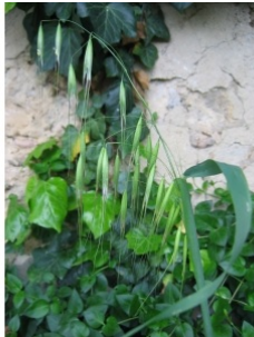
à inconnu observée le 11 mai 2010 par Sébastien Jéssel

Réseau Tela botanica, Programme Flora Data, version dynamique.