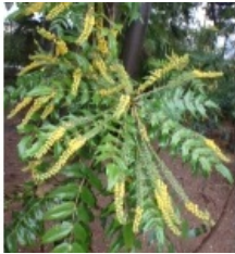
à inconnu observée le 1 janvier 2013 par Genevieve Botti

Réseau Tela botanica, Programme Flora Data, version dynamique.