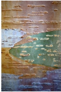
à inconnu observée le 26 octobre 2011 par Muriel Martinet

Réseau Tela botanica, Programme Flora Data, version dynamique.