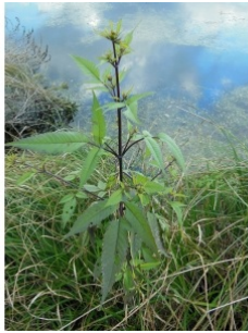
à inconnu observée le 1 décembre 2013 par Quentin Lebastard

Réseau Tela botanica, Programme Flora Data, version dynamique.