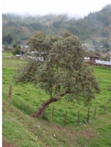
à inconnu observée le 23 janvier 2010 par Genevieve Botti

Réseau Ēla botanica, Programme Flora Data, version dynamique.