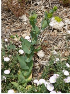
à inconnu observée le 30 mai 2017 par françoise Dumas

Réseau Tela botanica, Programme Flora Data, version dynamique.