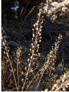
à inconnu observée le 12 juin 2016 par Denis FILOSA

Réseau Tela botanica, Programme Flora Data, version dynamique.