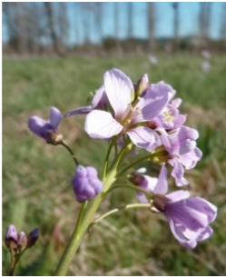
à inconnu observée le 27 mars 2014 par natureIn

Réseau Tela botanica, Programme Flora Data, version dynamique.