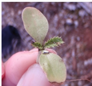
à inconnu observée le 3 mars 2012 par Genevieve Botti

Réseau Tela botanica, Programme Flora Data, version dynamique.