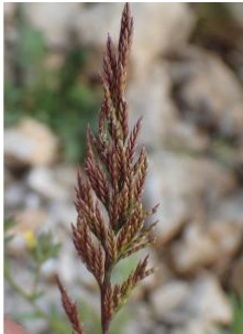
à inconnu observée le 18 mai 2017 par Genevieve Botti

Réseau Tela botanica, Programme Flora Data, version dynamique.