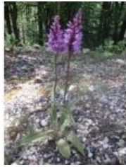
à inconnu observée le 1 juillet 2013 par Genevieve Botti

Réseau Tela botanica, Programme Flora Data, version dynamique.