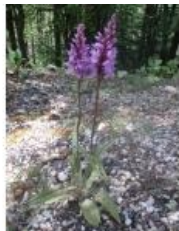
à inconnu observée le 1 juillet 2013 par Genevieve Botti

Réseau Tela botanica, Programme Flora Data, version dynamique.