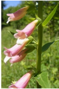
à inconnu observée le 27 juin 2012 par Jean-Claude Calais

Réseau Tela botanica, Programme Flora Data, version dynamique.