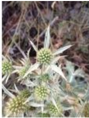
à inconnu observée le 9 juillet 2013 par Pierre Bonnet

Réseau Tela botanica, Programme Flora Data, version dynamique.