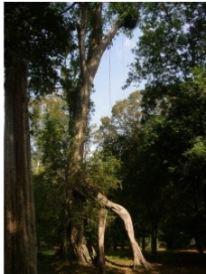
à inconnu observée le 2 mars 2006 par Genevieve Botti

Réseau Tela botanica, Programme Flora Data, version dynamique.