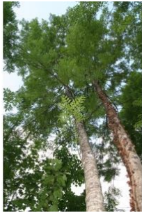
à inconnu observée le 11 mai 2008 par Alain Létrange

Réseau Tela botanica, Programme Flora Data, version dynamique.